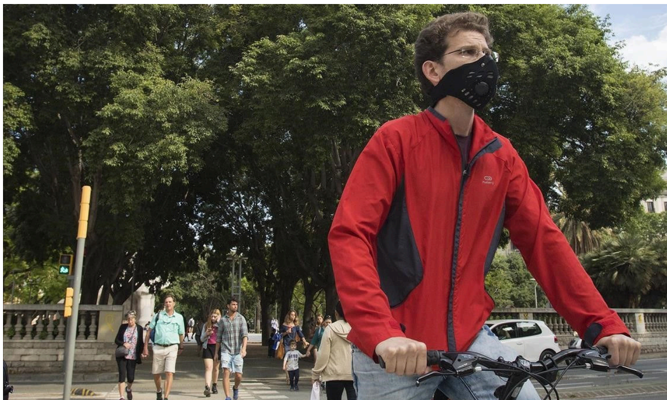
Un ciclista circula con mascarilla en la plaza de Tetuán.

https://www.elperiodico.com/es/sociedad/20180522/aumento-alergia-catalunya-6833386